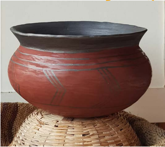
Bol Wettolsheim (68) 1er âge du Fer