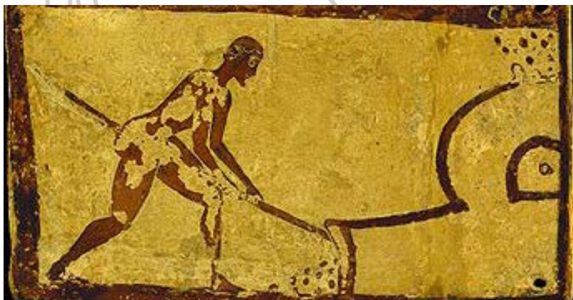
Plaquette votive de Penteskouphia - Grèce

Des cuissons choisies en fonction de l'époque de la céramique à reproduire.