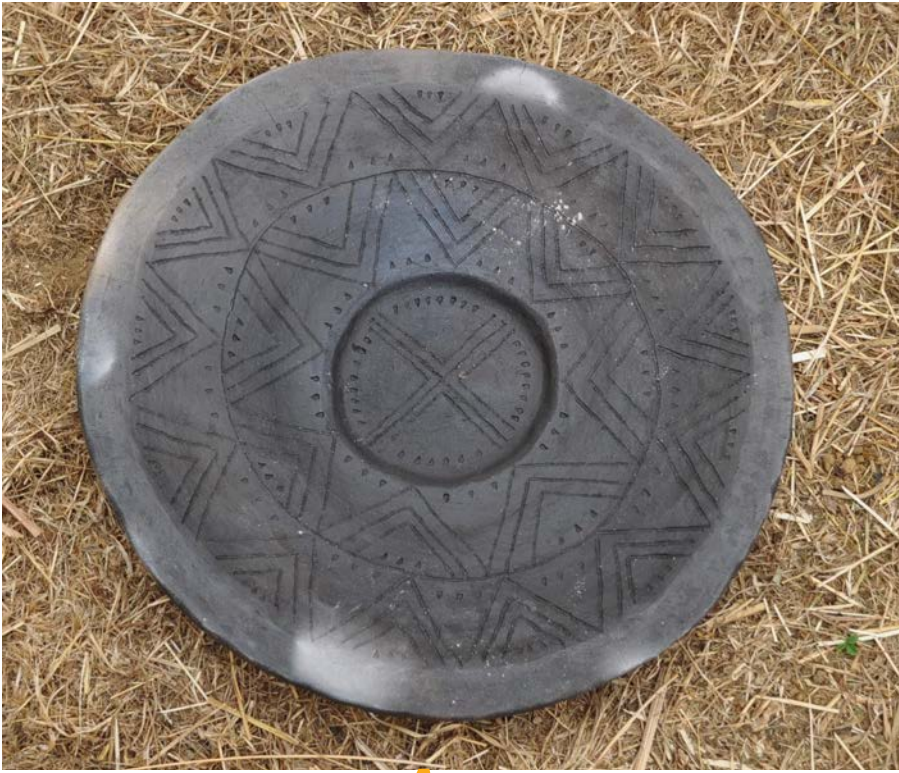
Plat Besançon 1er âge du Fer