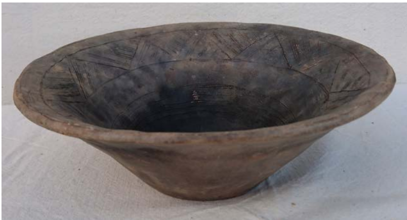
Coupe Zug (CH)