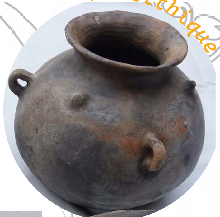
Pot à suspension Clairvaux (39)

Fabrication, sur commande de vase du Néolithique : godet, pot à suspension, coupe ... Cuisson en fosse.