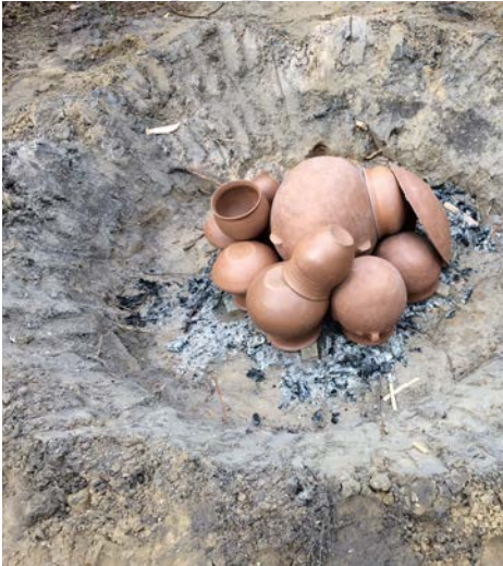
Cuisson en fosse ou en meule