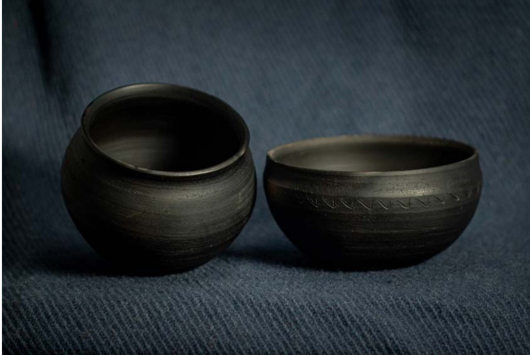
Gobelet Haithabu et Bol Birka, scandinavie