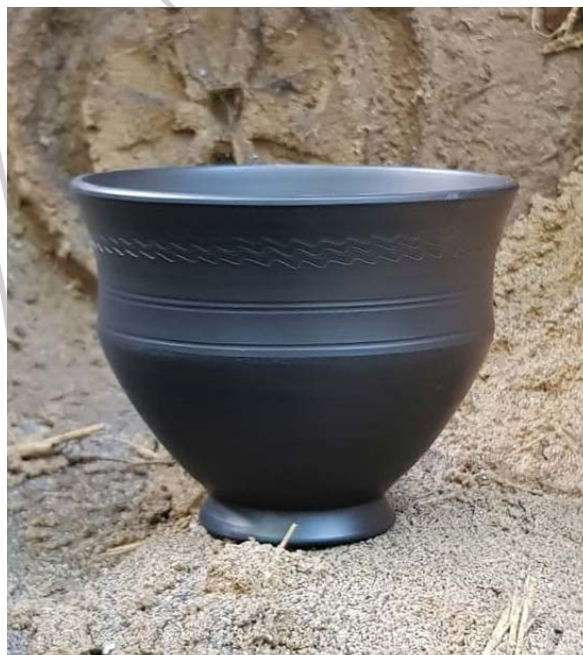
Coupe et gobelet Grotte de Vogué (07)