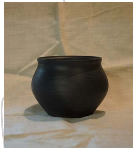
Gobelets de Bibracte (58)