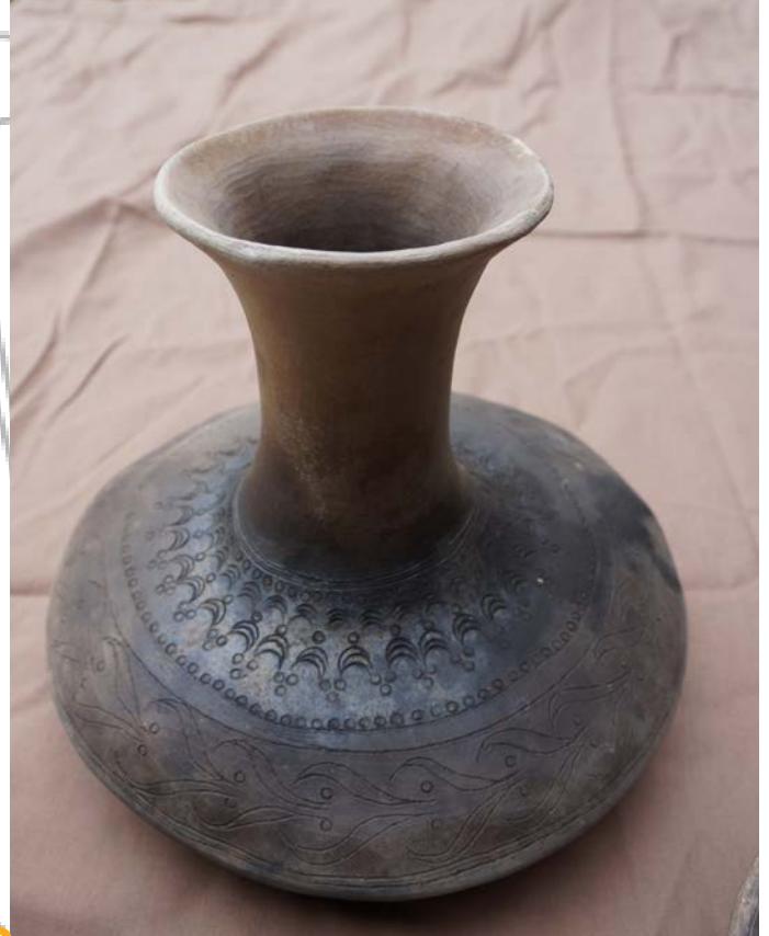
Bouteille Matzhausen (D) 1er âge du Fer